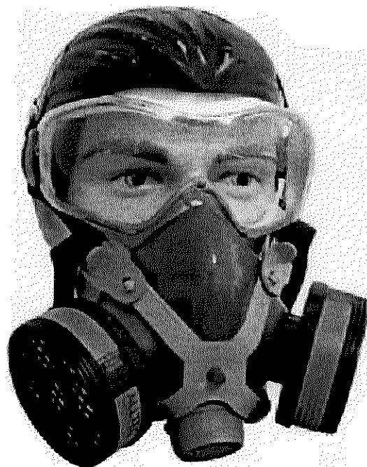
Máscara Respiratória Dupla Contra Agrotóxicos Pesticidas = TOTAL DE 04. .....