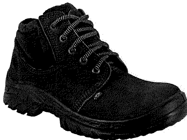
Bota botina de segurança amarrar marrom nubuck epi Ecosafety.